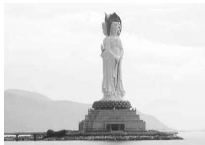
写真25 海南島三面觀音像