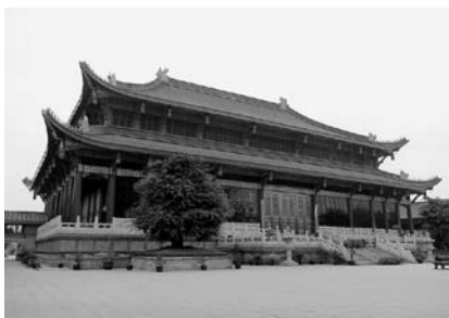
写真11 峨眉山近くの寺院大殿

唐代に盛んだった密教が、中国大陆に絶えて久しいが、近年は密教の復興運動も起こっている。紹興市近郊に、明心書院（写真10）という道場が造営され、居士が集い、梵語で真言を唱えている。また「唐密」と称し、ひそかに密教が伝承されていたものを復興するとして、広西チワン族自治区南寧市上林県金蓮湖には、蓮音寺という巨大寺院が建設中である。