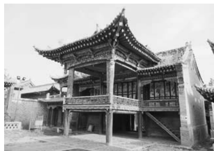
写真37 丹噶爾古城城隍廟戲台