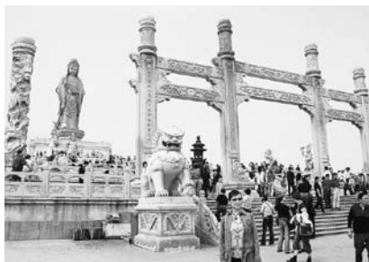
写真24 普陀山南海漢音像