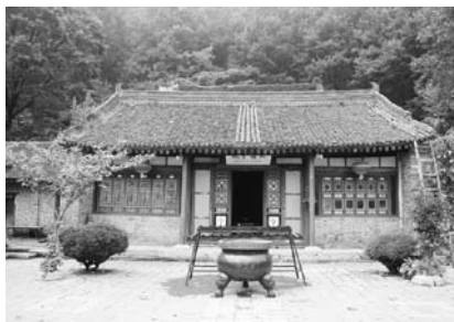
写真43 終南山悟真寺

うか。一つの方向性を顕著に示すものとしてよく挙げられる例は、河南省登封市の嵩山少林寺である。2009年12月27日、少林寺は香港の旅行社と合併で、登封嵩山少林文化旅游有限公司を発足させた。観光開発や武術文化を、効率的に発展させるためという。このニュースは、日本のマスコミでも大きめに上げられた。少林寺は、以前から各地の寺院経営にも関与したり、