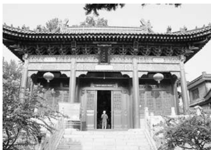
写真29 大興善寺平安地藏殿