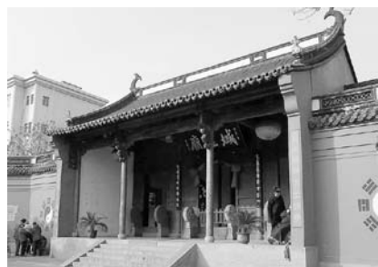
写真35 塩官県城隍廟

死後の世界といえば、中国の墓地事情は日本と大きく異なっている。中国では建国以来都市部に古くから存在した墓地を破壊して再開発してきた。寺院に附属する墓地はなくなり、郊外に大規模な霊園が造成されてきた。そのため、日本における彼岸や盆にあたる、四月初めの清明節には、墓参のため近郊に向かう車で、大渋滞が発生する。