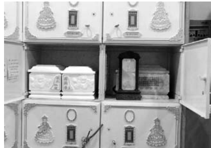
写真42 禪源寺仏塔内部納骨堂2

墓苑は、かつては公的なものであったが、現在では墓地ビジネスの業者が開発し、年々価格が高騰している。こういった現象にともない、墓域を持たない寺院でも、新たな「檀徒」を取り込もうとしている。浙江省臨安市西天目山にある禪源寺は、清初に玉琳国師によって創建された名刹であるが、近年大規模な造営を行い、寺観が一新された（写真40）。鉄筋七層の玉琳国師塔内には、ロッカー式の納骨堂（写真41）が設置されており、夫婦で納骨できるようになっている（写真42）。墓苑の造成ではないが、杭州市・上海市などの近隣都市住民を対象にした、新たな寺院の収入源となっているのである。