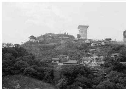
写真31 酆都鬼城全景