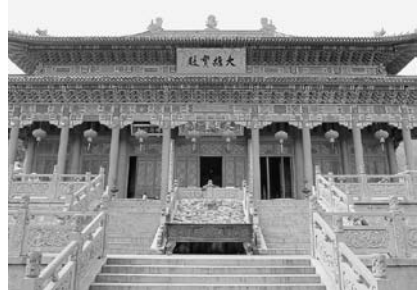
写真40 天目山禪源寺