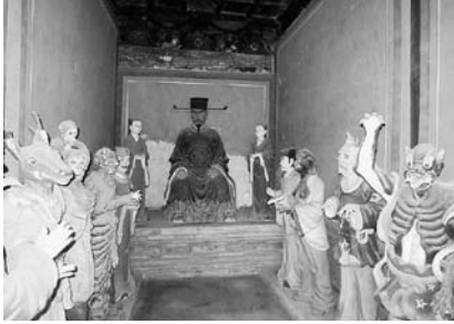
写真39 東嶽廟地獄七十二司