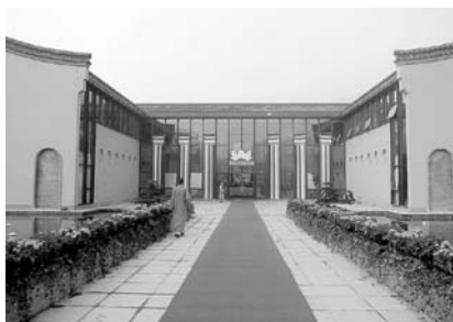
写真1 杭州佛学院本館