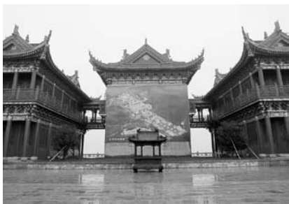
写真9 建築中の龍華寺伽藍