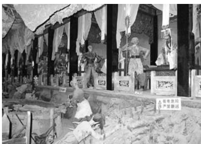
写真34 鬼国神宮内部