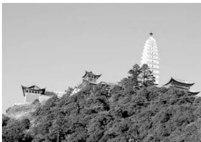
写真21 鶏足山金頂寺

像群（写真20）があり、やはり唐代の造立にかかる。敦煌石窟の塑像・石像と同様、まことに貴重な存在となっている。古い文物を大切に保存する文化が、近代中国には欠けていたが、山西省には全国の古建築の七割が集中しており、山に囲まれた地方ゆえの開発の著しい遅延が、逆に幸いした形となっている。