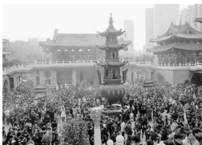
写真4 静安寺・春節の賑わい