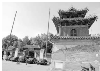
写真38 北京市東嶽廟