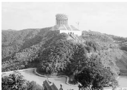
写真8 龍華寺兜率天宮