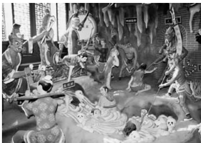
写真30 平安地蔵殿内部

このように立体的な地獄世界の縮小版は、浙江省海寧市塩官县城隍廟（写真35・36）や、青海省湟源县丹噶爾古城城隍廟（写真37）など中国の各地にあり、その恐ろしさを説きながら、現世で正しく生きるべきことを教えてい