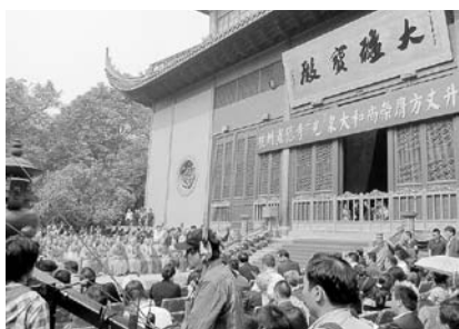
写真7 靈隠寺・光泉大和尚升座式2

著名であるが、唐代から日本との交流が盛んな地域である。杭州には、浄慈寺・上天竺寺・中天竺寺・下天竺寺などの有名寺院があるが、最大の寺院は靈隠寺(写真5)である。白居易の詩にも詠まれる古刹は人で溢れかえり、ここに向かう道路は常に渋滞している。2011年11月8日、この靈隠寺光泉大和尚の方丈(住職)升座慶典(晋山式)が挙行された(写真6・7)。私も、日本人招待客3名の一人として参列することができたが、全国有力寺院住持や杭州市政府要人が数多く招待される、大規模で華々しいものであった。