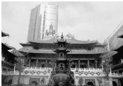
写真3 静安寺新本堂