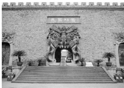
写真33 酆都鬼城・鬼国神宮