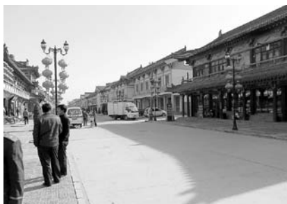
写真17 遼代風と称する街並み