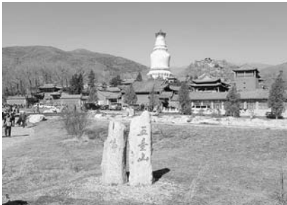
写真14 五台山顯通寺 ここにかつて市街地があった