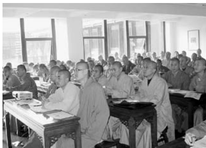
写真2 杭州佛学院大教室で講演を聴く学生