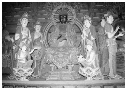
写真20 仏光寺唐代塑像群