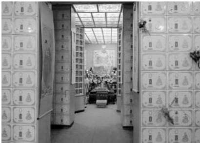
写真41 禪源寺仏塔内部納骨堂1