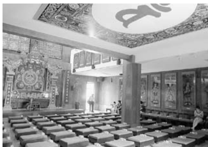
写真10 紹興市・明心書院