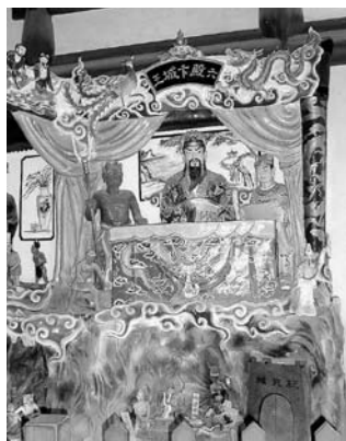
写真36 塩官城隍廟内部