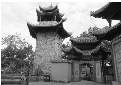
写真32 酆都鬼城望郷台