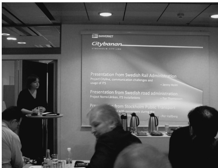
図 35 Citybanan プロジェクトの説明風景