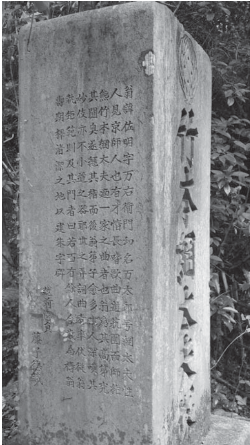
『時雨の炬燵』成立考

(4) 神戸女子大学図書館(森修文庫五〇〇六)は、大判縦長の一枚摺。石水博物館(21京その他041)は、通常・横長の役割番付。