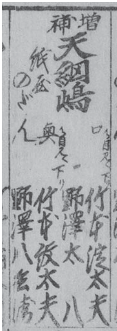
図三 『妹背山婦女庭訓』番付部分（石水博物館）

『義太夫年表 近世篇』が文化三年（一八〇六）の九月か十月と推定した、図三の江戸結城座『妹背山婦女庭訓』興行において、三代紋太夫は付け物に『増補天網島』『紙屋の段』奥を語っている。「御目見へ」「下り」と肩書した