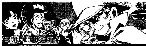
图 2-3 中国有关《名侦探柯南》的网站之一