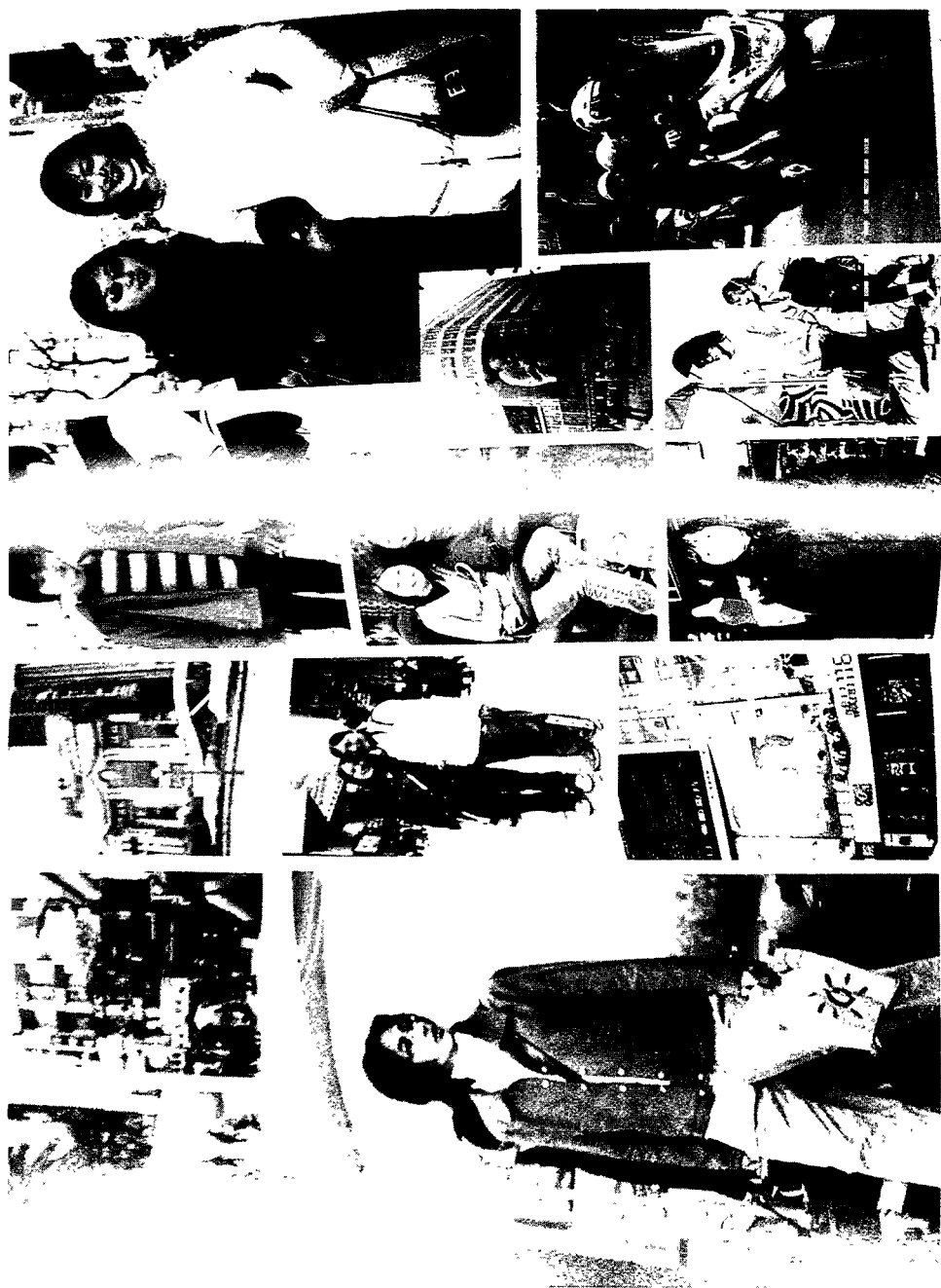
图1 你能看出他们是哪个城市的小伙子或小姑娘吗？ 《从这儿开始亚洲销售战略》的照片