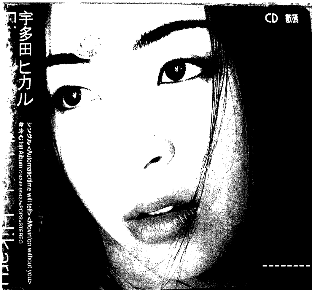
图5 福建版宇多田光的《First Love》，请注意右上边“数碼”两个字