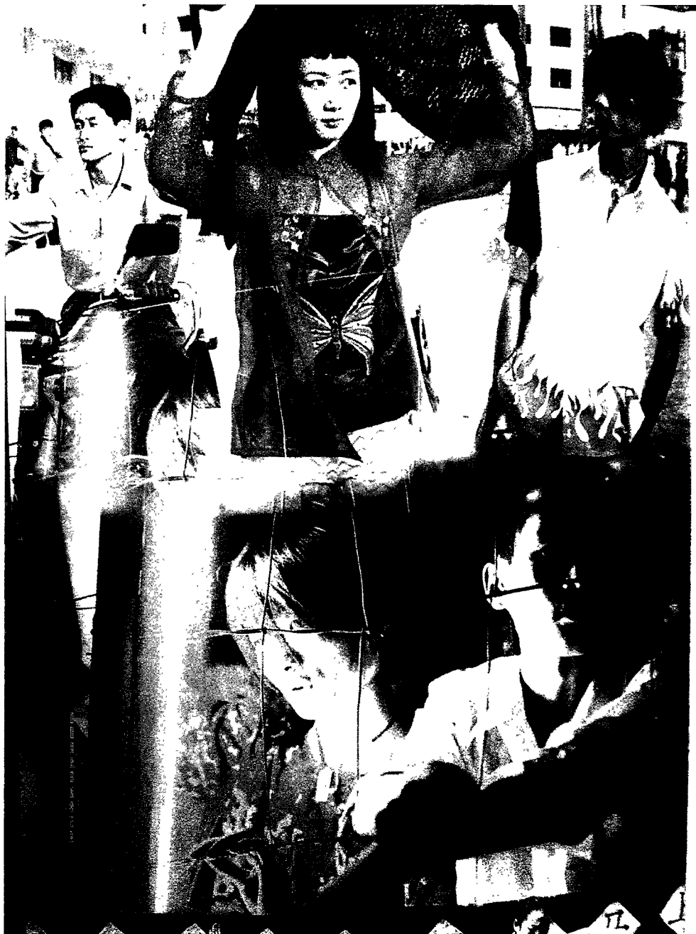
图8 贾樟柯《任逍遥》宣传册的一页