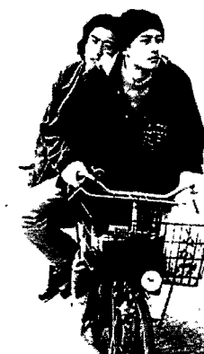
图6 北野武《坏孩子的天空（原题：Kids Return）》剧照