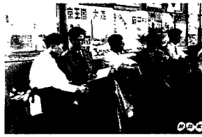
图 9-3 《X计划》场景，介绍在经济还不太发展的 60 年代，就这样开发世界最高水准电脑