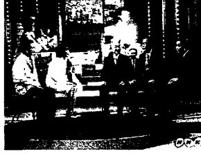
图 9-1 《X计划》场景