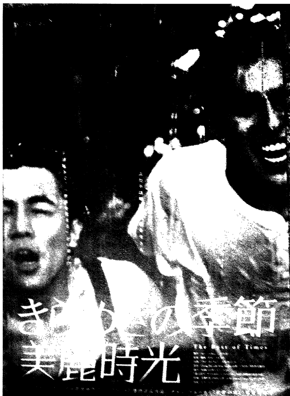
图7 张作骥《美丽时光》宣传册的封面