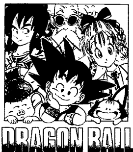
卷一 小悟空和他的伙伴们