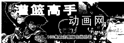
图 2-1 中国有关《灌篮高手》的网站之一