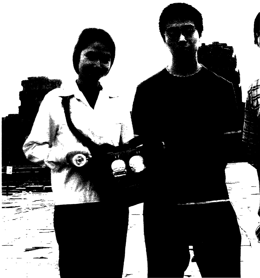
图4 柬埔寨的导游小姐皮包上的《流氓兔》