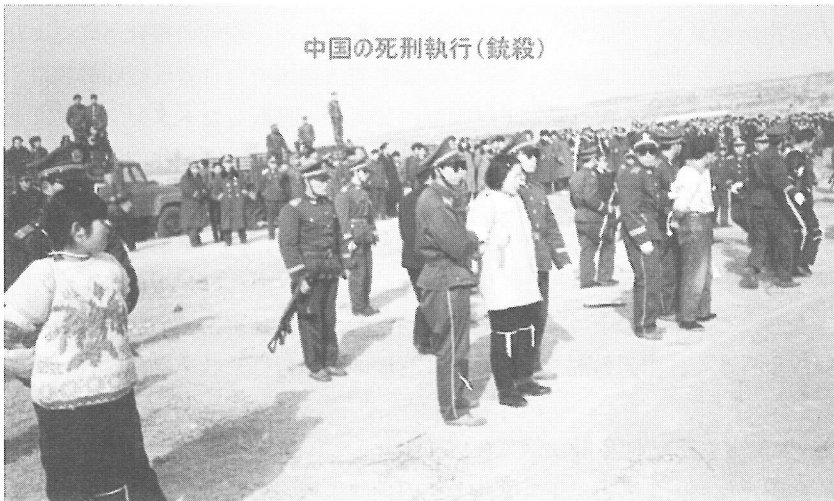
図2 中国における死刑執行（銃殺）の様子

(2) 死刑の執行方法 中国では、死刑の執行方法について、従来「銃殺とする」と定められていたが、1997年に施行された改正刑事訴訟法で「銃殺または注射等」と2つの方法に改正された。銃殺の場合には、通常軍人の一種で