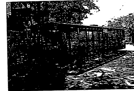
首相府に近い路上で炎上したバンコク都バス (4月14日)

赤シャツ派は、バンコク旧中心部の交差点などで、強奪したバスに火を付けて、あるいは古タイヤを燃やして交通をマヒさせた。ペップリー路の起点ヨマラート周辺や同路ソーイ5やソーイ7では、赤シャツ隊は反赤シャツ派の住民と衝突し、投石や銃撃が生じた。この日の負傷者は合計113名(含む2名の死者)で、この内兵士の負傷者は27人と報道された。死者の二名とは、総理府に近いナーンローン Nang