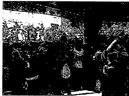
4月11日 割れたメディアセンターの玄関ガラス戸から中へ侵入する赤シャツ隊

8時40分、両者が10メートルの距離を置いて対峙していた場所で、小競り合いが始まった。投石が繰り返され、銃声も響いたようだ。しかし、白兵戦に発展することもなく、間もなく収まった。警察は両者の衝突に何等介入しなかった。この後、赤シャツと紺シャツとの間に話しがついたということで、両者の衝突はもう生じなかった。