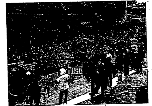
4月10日 パタヤーのアセアン会場のホテルに一時なだれ込んだ赤シャツ隊