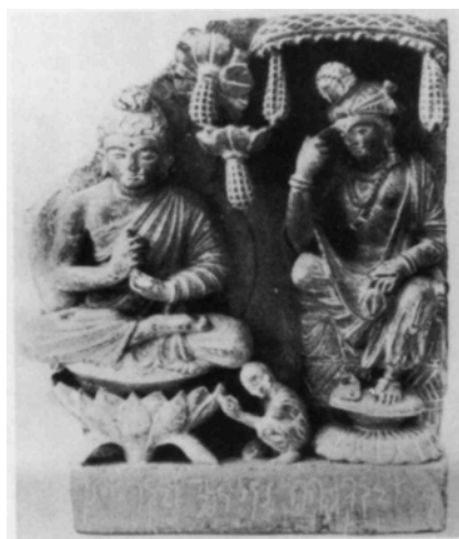
図 1-9. 刻銘三尊像