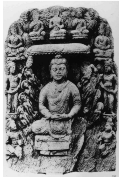
図 1-14. 千仏化現図