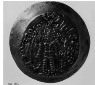
図 1-13. キダーラクシャーンコイン