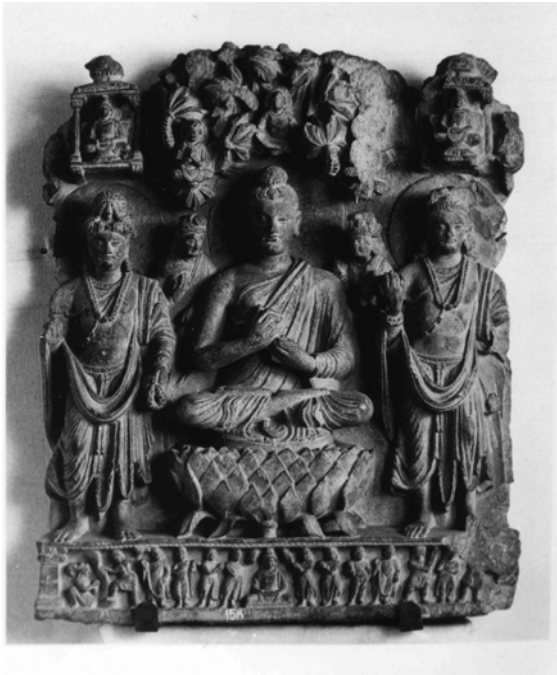
図 1-11. サフリバロール出土仏三尊像