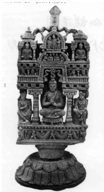
図 1-17. 仏說法図