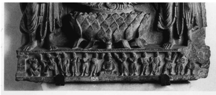
図 1-16. サフリバロール出土仏三尊像 台座部分