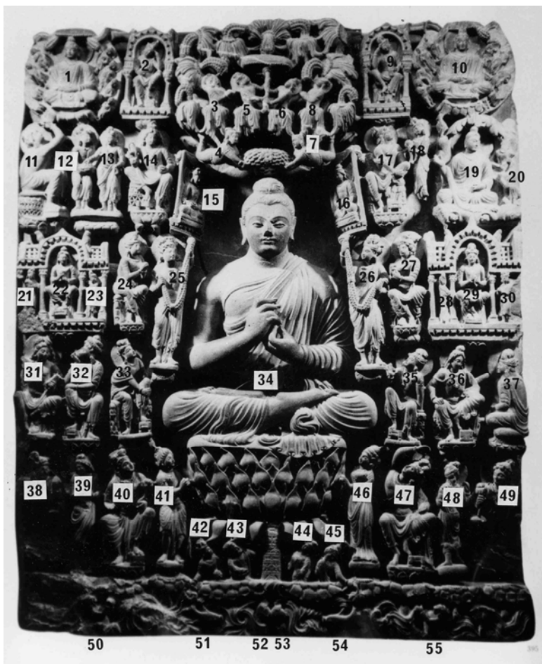
図 1-8. 仏説法図