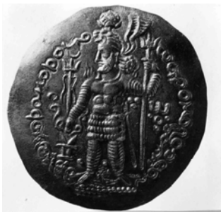
図 1-12. クシャノササーンコイン ホルムズド王