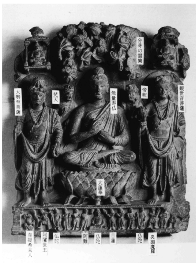
図 1-18. サフリバロール出土仏三尊像