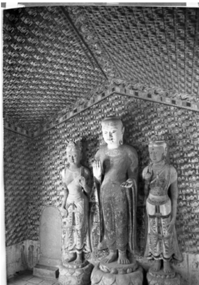
図 2-35 仏三尊と千仏表現 第 427 窟