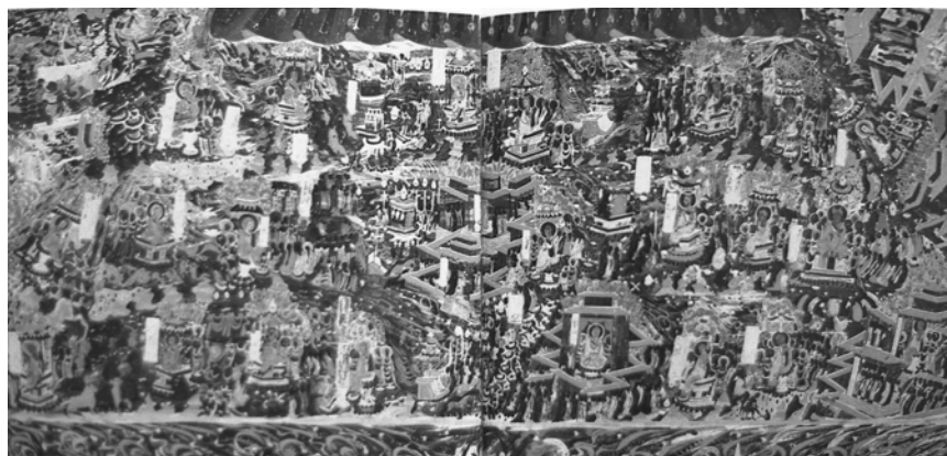
図 2-36 法華經變相(方便品) 第 420 窟