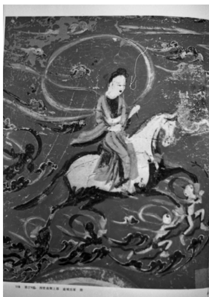
図 2-41 逾城出家図 第 278 窟