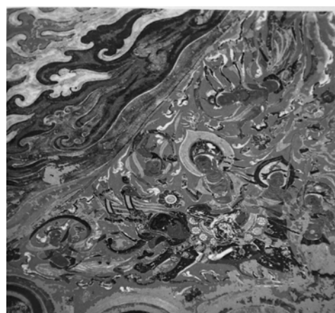
図 2-44 乘象入胎図 第 397 窟