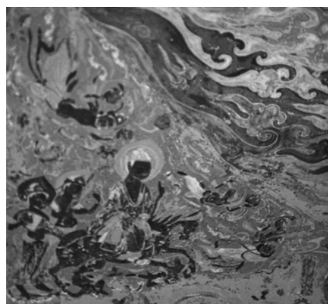
図 2-43 逾城出家図 第 397 窟