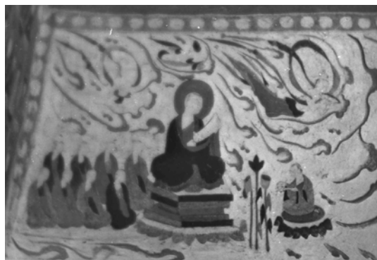
図 2-38 持經說法図 第 280 窟