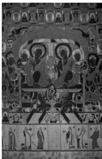
図 2-37 二仏並坐と千仏表現 第 303 窟