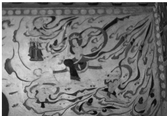
図 2-39 乘象入胎図 第 280 窟