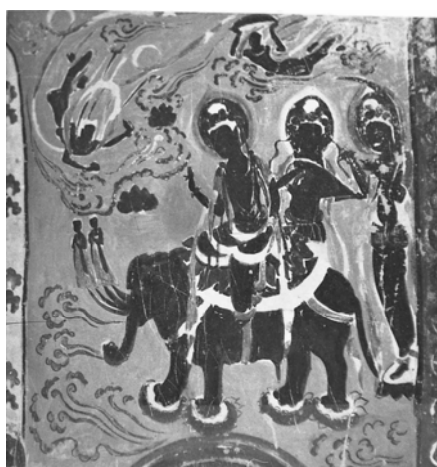
図 2-40 乘象入胎図 第 375 窟