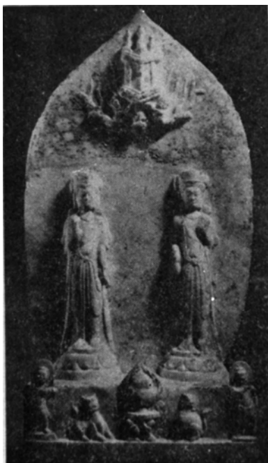
図 3-27 石造双観音像