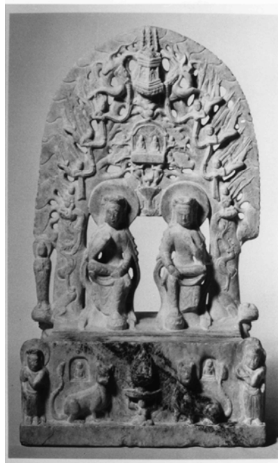
図 3-29 石造双弥勒半跏像