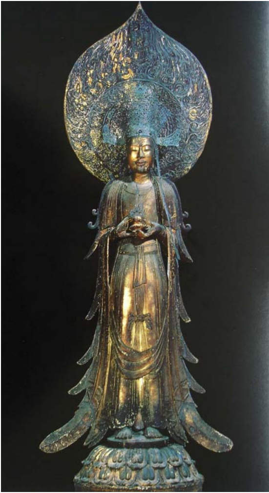
図 3-25 夢殿救世観音