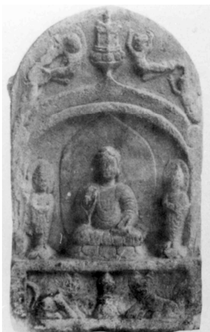
図 3-28 石造坐仏三尊像