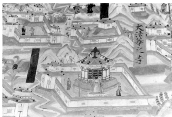
图 3-22 五台山图(部分)八角堂