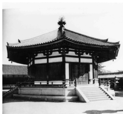
图 3-24 法隆寺夢殿