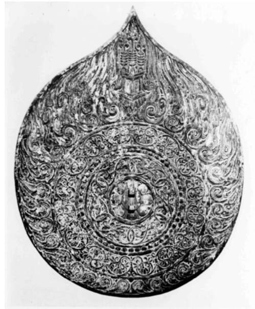
図 3-26 救世観音像光背