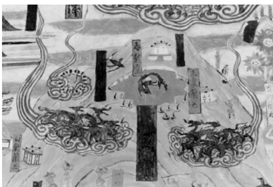
图 3-23 五台山图(部分)北台之項