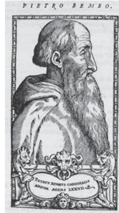
図4.6 ベンボ肖像 (p. 95)