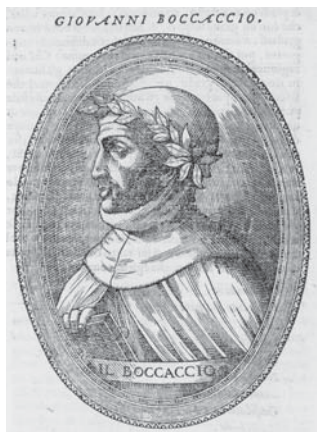
図4.3 ボッカチオ肖像 (p. 51)