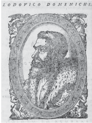
図4.5 ドメニキ肖像 (p. 78)