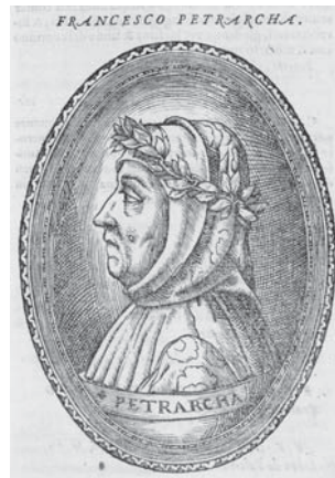
図4.2 ペトラルカ肖像 (p. 45)