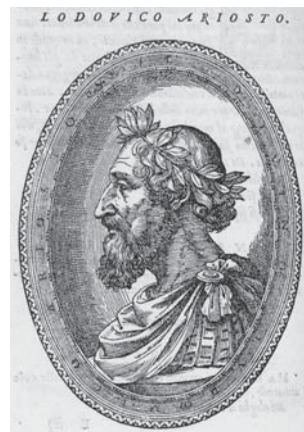
図4.4 アリオスト肖像 (p. 72)