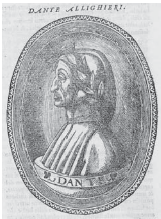
図4.1 ダンテ肖像 (p. 41)