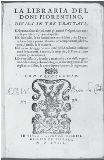
図1 タイトルページ