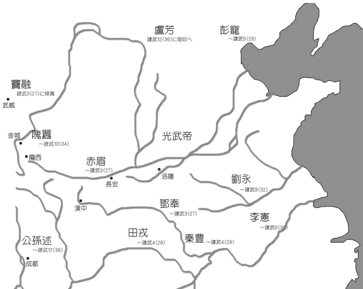
〔図1〕後漢初期（建武1～12年）の勢力図

とある。これは、王莽死後、建武十六年に、布帛・黄金・粟が「貨幣（経済的流通手段）」であったことをしめしている。もともと本文には、その時期に錢も「貨幣」であったとは明記されていない。しかし先学も指摘するように、当時錢が流通していたことは他の史料からも看取しうる。その好例として、「更始二年」の紀年をもつ「五銖」錢の錢範があること、建武三年・四年・六年の紀年をもつ居延漢簡に錢関連の記載があることが挙げられる。これより錢は、王莽期以降、一貫して流通し続けていたと論定される。つまり王莽死後、建武