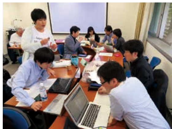
第2部 グループに分かれて課題をこなす参加者たち