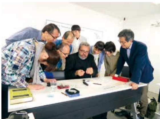
第1部 一枚の貨幣からどのような情報が得られるか議論する参加者たち

1517) 治下のシリアとエジプトにおいて発行された貨幣から当時の社会経済を再構成することを目指すものであった。各セッションの最初にトピックについての解説がなされ、その後、シュルツ氏の個人コレクションの貨幣が参加者一人一人に配られた。参加者は手元の貨幣を素手で触ることが許され、そこからどのような情報が得られるか参考文献を参照しながら検討し、結果と疑問点などについて議論するというスタイルで進められた。参加者は、普段ガラスケース越しに見ることはできても触る機会にはほとんど恵まれない実物の貨幣に触れるという貴重な体験をしたのはもちろんのこと、残されたモノからどのように歴史を構成していくかという課題について挑戦した。