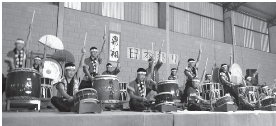
図6 2015年撮影 日本祭にて太鼓部発表

中でも太鼓部の存在は輝かしい。太鼓部では日系の子どものほとんどが所属し、手のひらに豆ができ、割れた上からまた豆ができるような血と汗握る練習を行い、ブラジル太鼓大会では3度の優勝経験を持つ。コロニア・ピニャールの太鼓部は地域の名をブラジル中にとどろかせた。その結果、村の行事で太鼓をたたけば、他地域からの訪問者が現れる。