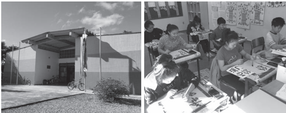
図 1・2 2016 年撮影 コロニア・ピニャール日本語モデル校外観／教室風景

筆者は国際協力機構（以後 JICA）日系社会青年ボランティア（現日系社会青年海外協力隊）として 2015 年 7 月～2018 年 7 月にブラジルのコロニア・ピニャールで活動した。主に、日本語学校で日本語教師として教壇に立ちながら、学校運営、地域行事への企画・運営・参加を行っていた。本論は移住地で暮らしてきた者の目線から伝えたい。