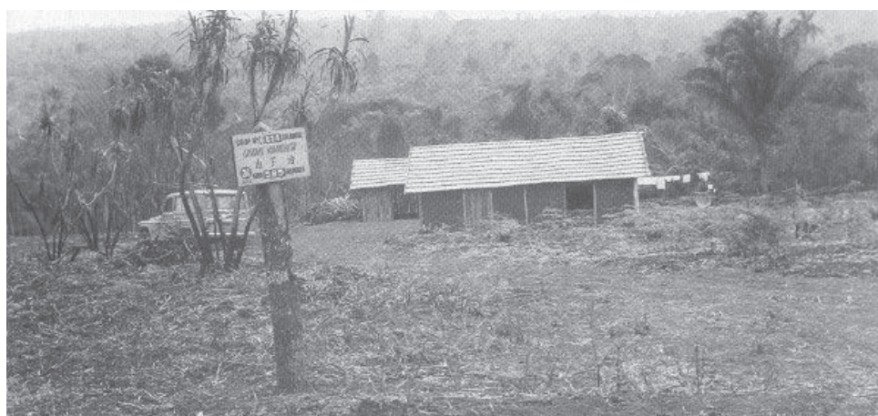
図3 1964年撮影 荒地地に建てた掘立小屋 山下治家

しかし、村の中では大学も仕事も無く、どんどん町へ出ていく若者が増えた。また、1990年代には出稼ぎのため多くの若者が日本へ旅立った。以後、若者の流出は進むばかりで、少子高齢化が問題とされている。