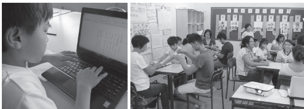
図4・5 PC学習/保護者参加型の授業参観と教室背後のポートフォリオ

子どもは平均して10年間日本語学校に通うため生活の一部である。保護者とは時代に合った子どもの教育方法を話し合う必要があり、親の教育方針と学校のできることをすり合わせながら子どもを育てていく方針を取っている。