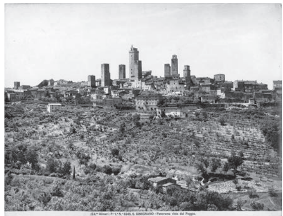
図4 サン・ジャミアーノの風景（「前田青邨渡欧中購入資料」のうち）