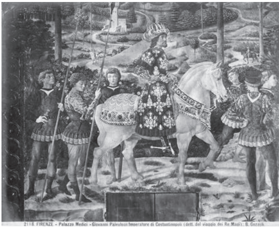
図21 ベノッツォ・ゴッツオリ《マギの旅》（部分） （「前田青邨渡欧中購入資料」のうち）