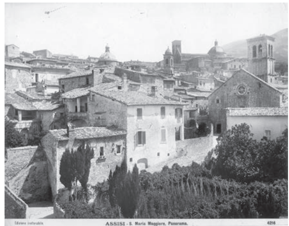
図6 聖マリア・マッジョーレ教会（「前田青邨渡欧中購入資料」のうち）