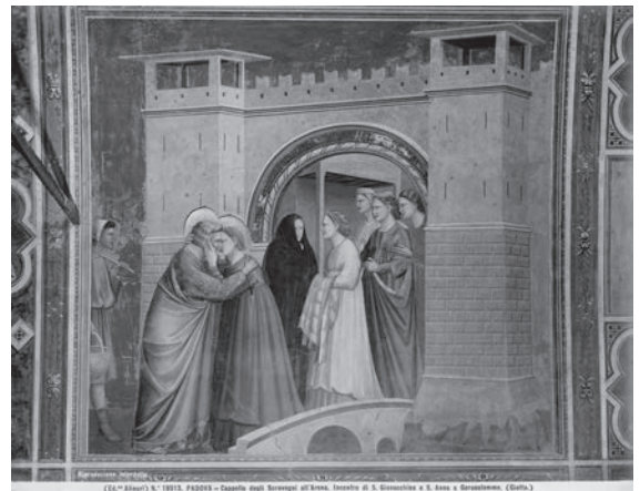
図12 ジョット《エルサレムでの聖ヨアキムと聖アンナの出会い》（「前田青邨渡欧中購入資料」のうち）