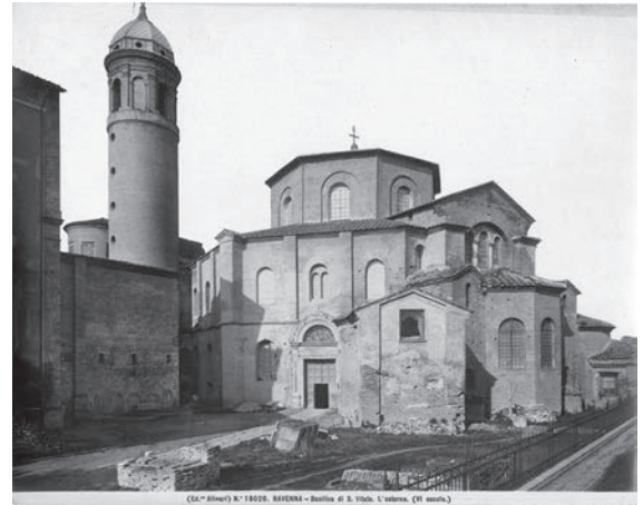
図8 聖ヴィターレ聖堂（「前田青邨渡欧中購入資料」のうち）