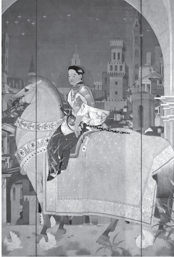
図1 前田青邨《羅馬使節》 早稲田大学會津八一記念博物館