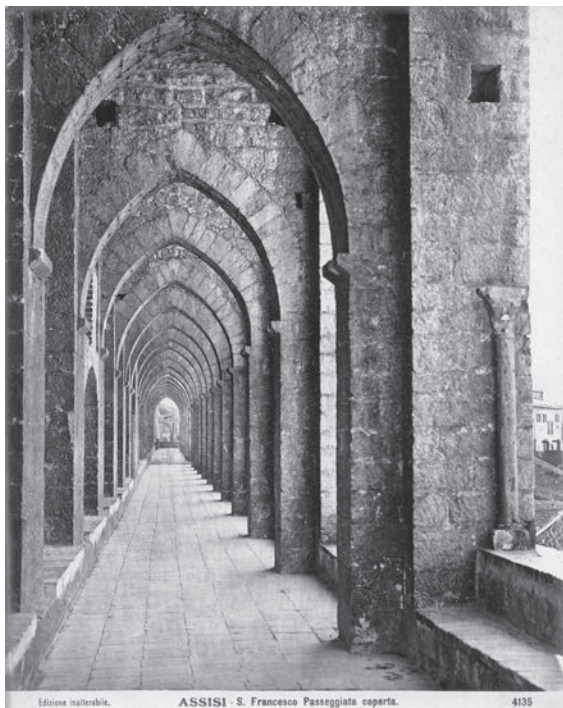
図17 聖フランチェスコの散歩道（「前田青邨渡欧 中購入資料」のうち）