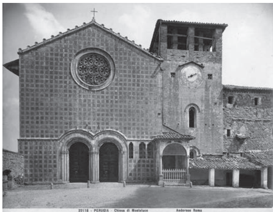
図9 モンテルーチェ教会（「前田青邨渡欧中購入資料」のうち）