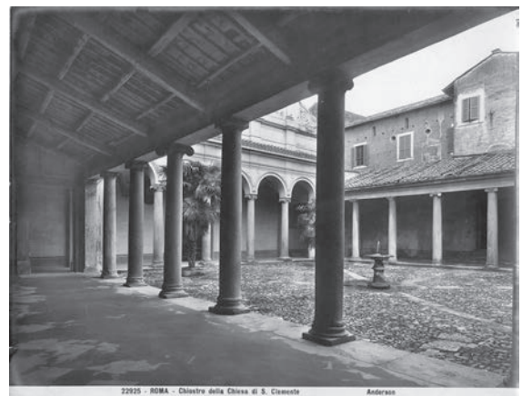
図18 サン・クレメンテ教会（「前田青邨渡欧中購 入資料」のうち）