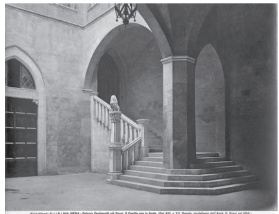
図16 ペッチ皇帝の城（「前田青邨渡欧中購入資料」 のうち）