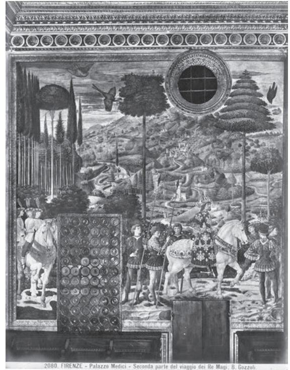
図20 ベノッツォ・ゴッツオリ《マギの旅》（「前田青邨渡欧中購入資料」のうち）