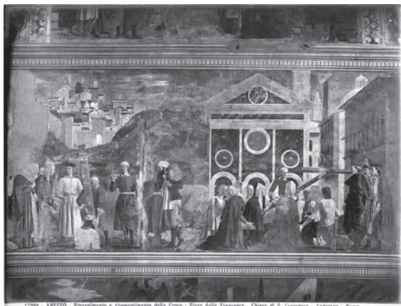
図11 ピエロ・デラ・フランチェスカ《十字架伝説》（「前田青邨渡欧中購入資料」のうち）