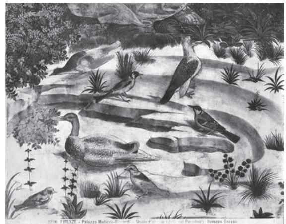
図22 ベノッツォ・ゴッツオリ《楽園の天使たち》（部分） （「前田青邨渡欧中購入資料」のうち）