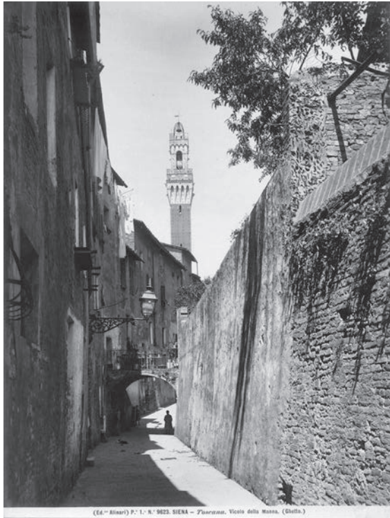
図7 シエナの塔（「前田青邨渡欧中購入資料」のうち）