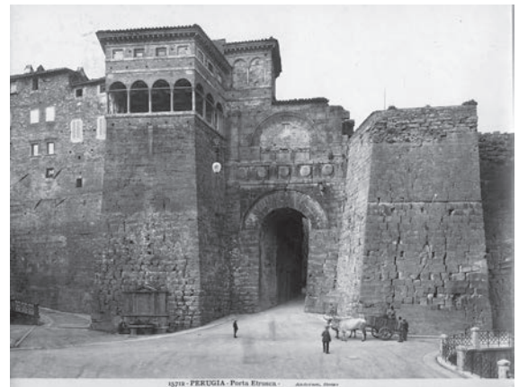
図10 エトルリアの門（「前田青邨渡欧中購入資料」のうち）