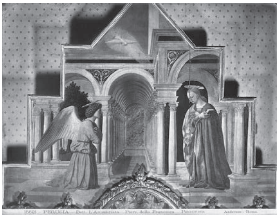
図15 ピエロ・デラ・フランチェスカ《サンタ ントニオの祭壇画》（部分）（「前田青邨渡欧中 購入資料」のうち）