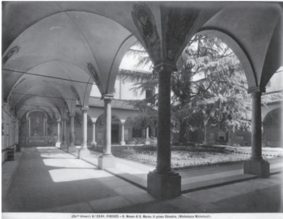
図19 サン・マルコ美術館の回廊（「前田青邨渡欧中購入資料」のうち）