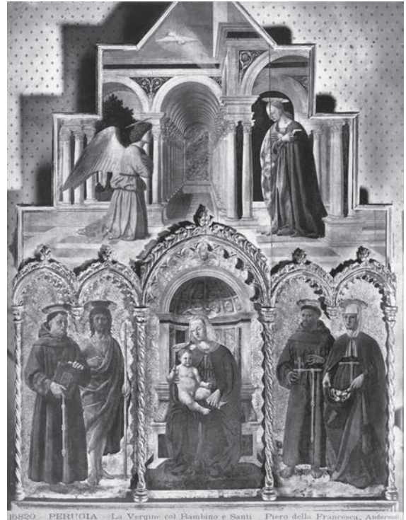
図14 ピエロ・デラ・フランチェスカ《サンタ ントニオの祭壇画》（「前田青邨渡欧中購入資料」のうち）