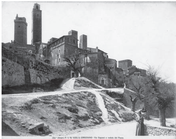
図5 サン・ジャミアーノの風景（「前田青邨渡欧中購入資料」のうち）