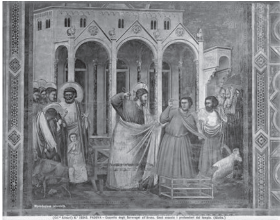
図13 ジョット《神殿から商人を追い払うイエス》 （「前田青邨渡欧中購入資料」のうち）