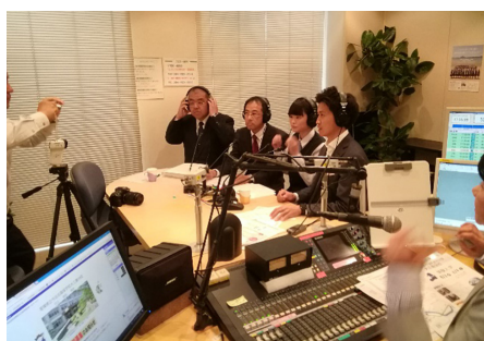
FM 福山でのラジオ収録

聞社には様々な機会を捉えて大三島分校についての数多くの記事を掲載していただいた。特に昨年度については、各紙に掲載された回数は延べ四五回を数え、大三島分校の生徒の活躍に対して紙面を見た多くの方からお声かけをいただき大変ありがたく感じている。 本校の看板となる部活動の一つである写真部の活躍もたびたびメディアで取り上げていただいた。特に写真甲子園での活躍については、新聞、テレビ等でも大きく紹介されるとともに、小学館発行の『写真甲子園シャッターガールmoment』というマンガにも、メインキャラクターのモデルとして取り上げられている。