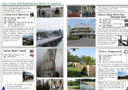
作成した英語版パンフレットの一部分

島の魅力を多くの人にPRするとともに、生徒の地域活性化への意識を向上させることなどを目的として、高校生目線で島の魅力を紹介したA5版六四ページのパンフレット「私たちの大三島」高校生が伝える大三島の魅力」を作成した。完成したパンフレットは島内外の各所に配架させていただいたり、高校生自らが配布しながら大三島の