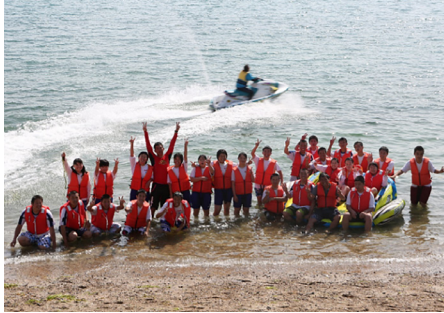
マリンスポーツの様子

平成二五年度に本校が実施した「地域活性化プロジェクト」の一環として始めた活動である。宮浦港から大山祇神社までの参道を歩きながら、観光客の方に、あまり知られていない参道の歴史や文化を紹介している。ガイドメンバーは有志の生徒約一五名で構成しており、ガイドを実践する前には、地域の歴史学習やコースの下見、役割分担の