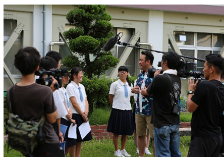
毎日放送の収録の様子