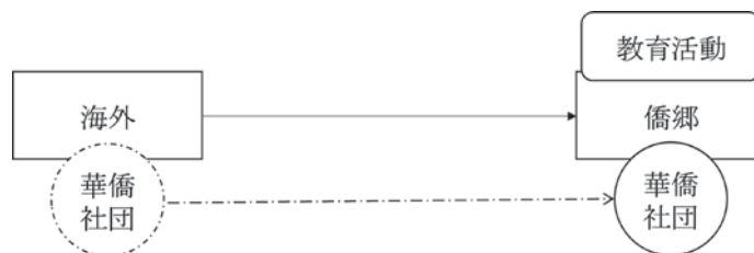
図1 華僑社団による対中教育支援のルート1