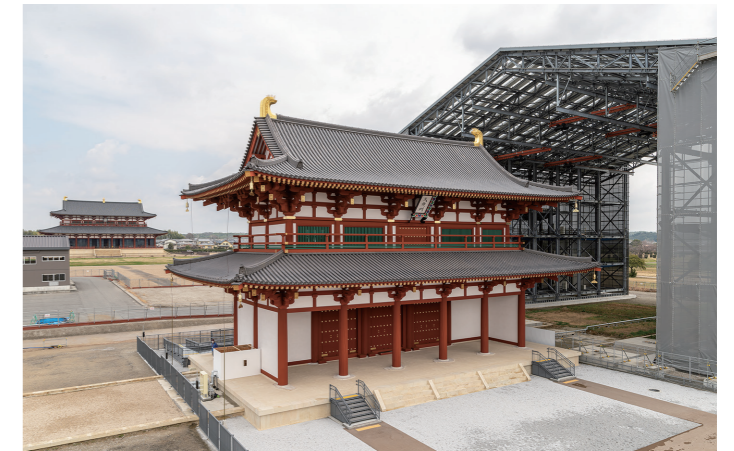
写真2 復原された平城宮中央区の大極殿南門

宮城正門の象徴性について、国際比較の視点から考えてみました。北京にある紫禁城の午門は現存しており、唐洛陽城